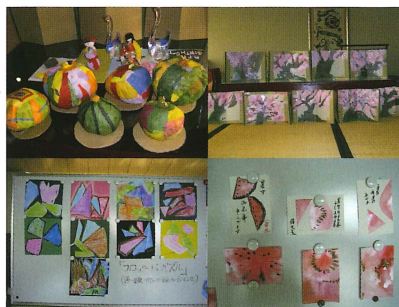
「脳いきいきアート塾」作品の一部

季節に合わせた行事、レクリエーション等に参加いただけます（自由参加）。月に2回、臨床美術士（絵画・造形などの創作活動を通じて心身の活性化を図る専門家）による「脳いきいきアート塾」を開催しています。