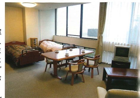
二人用居室（※写真はモデルルームです）

居室は1人用居室と2人用居室（1人入居も可）があります。2人用居室には200VのIHクッキングヒーターとシンクが一体となった安全・清潔なミニキッチン、浴室、洗濯スペース、エアコンを備えているほか、トイレはウォシュレット、緊急コールも付き、緊急時にはスタッフがすぐに駆けつけます。その他1人用居室には、トイレ、洗面、エアコン、ミニキッチン等が完備されています。※1人用居室については、ミニキッチンが無い居室もあります。詳しくは係員におたずねください。