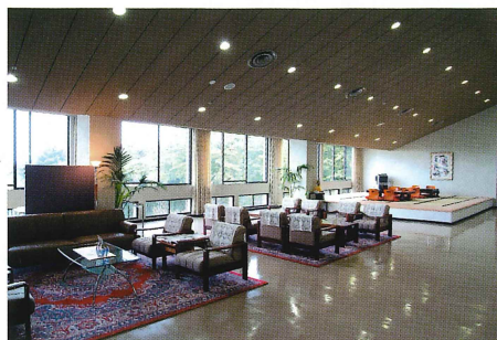
ロビー（多目的ホール）

広々としてゆったりとしたロビー、眺望の良さと緑に包まれた静かな空間、奈良盆地を一望できる景色は、毎日の生活にやすらぎとuringおいを与えてくれます。