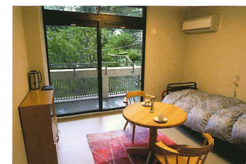
一人用居室（※写真はモデルルームです）