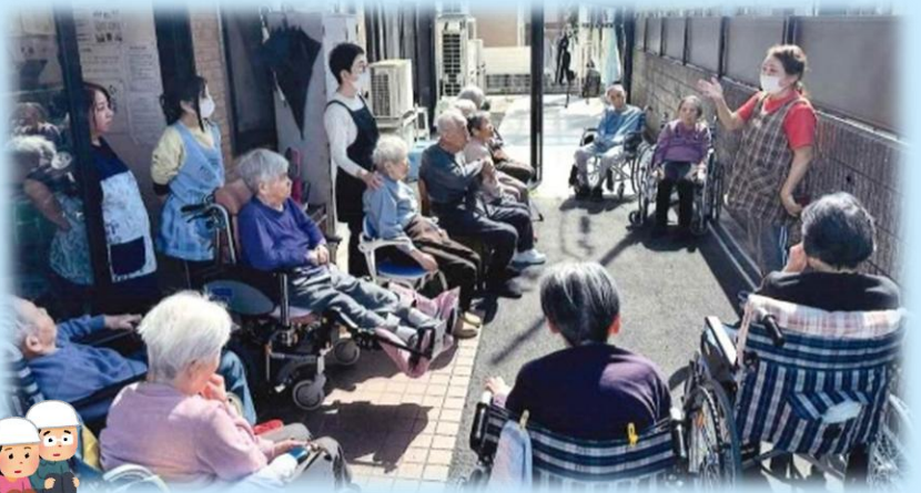
いざという時に備えて避難訓練